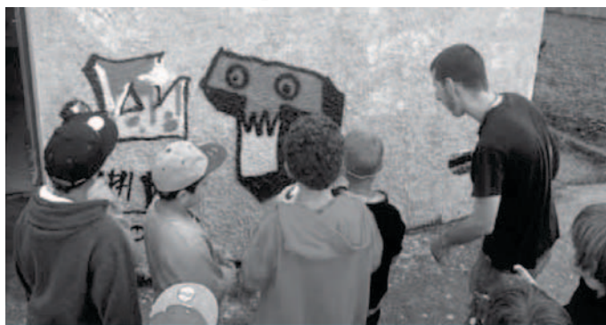
Des conseils suivis avec attention...