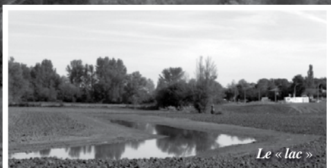
Le « lac »