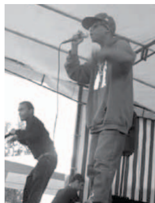
Rap hip-hop par le groupe Antinomic